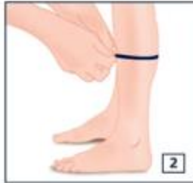
Circunferência da barriga da perna: na zona mais larga