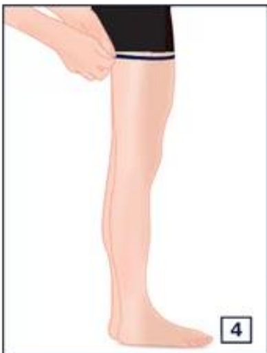
Circunferência da coxa: Na zona mais larga