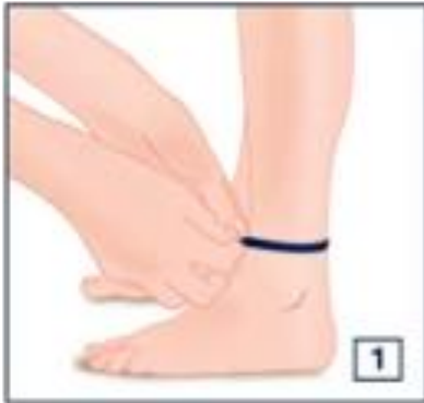
Circunferência do tornozelo: Acima do maléolo na zona mais fina

Modelo A-G (até à raiz da coxa) e AT (collant):.....Seguir imagens 1 a 5